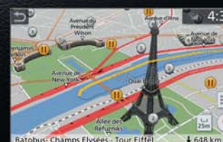
3D MAPY: Navigace pro vaše cesty světem s 3D mapami.

Zcela nový informační a zábavní systém vozu Qashqai přichází s novými vzrušujícími funkcemi, jako jsou 3D mapy, integrace chytrého telefonu, hlasové ovládání a 7palcový vícedotykový displej, který si můžete upravit podle svých představ. Nový systém NissanConnect rovněž umožňuje ovládat váš chytrý telefon známým způsobem pomocí aplikací Apple CarPlay®* a Android Auto®.