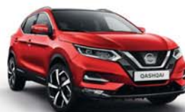
ČERVENÁ FLAME - S - Z10

(*) balíček Dynamic standard pro Tekna+, volitelné pro Tekna a N-Connecta