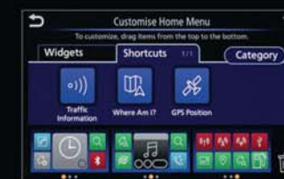
UPRAVTE SI ÚVODNÍ NABÍDKU: Nastavte si vlastní zobrazení nepoužívanějších funkcí, jako je audiosystém, historie volání a dopravní informace.