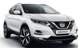
BÍLÁ - S - 326