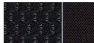
ČERNÉ TEXTILNÍ ČALOUNĚNÍ