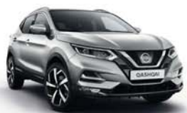
STŘÍBRNÁ SATIN - M - KYO