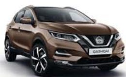
BRONZOVÁ CHESTNUT - M - CAN