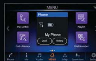
ROZPOZNÁVÁNÍ HLASU: Po stisknutí tlačítka hovoru na volantu můžete bezpečně hlasem ovládat navigaci, přehrávání hudby a telefon.