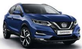
MODRÁ INK - M - RBN