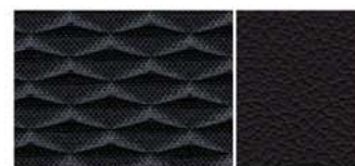
KOMBINACE ČERNÉ KŮŽE A TEXTILNÍHO ČALOUNĚNÍ, MONOFORNÍ SEDADLA