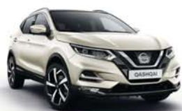
BÍLÁ PEARL - M - QAB (*)