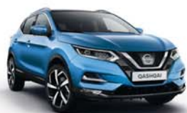
MODRÁ VIVID - M - RCA (*)