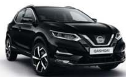
ČERNÁ PEARLESCENT - M - Z11 (*)