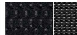
ČERNÉ TEXTILNÍ ČALOUNĚNÍ