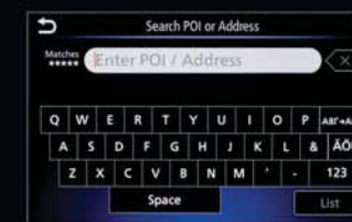
VYHLEDÁVÁNÍ POMOCÍ JEDNOHO ŘÁDKU: Rychlé a pohodlné vyhledávání cíle nebo bodů zájmu.

VAŠE HUDBA, VÁŠ STYL Přistupujte ke své hudbě pomocí Bluetooth či USB nebo se připojte pomocí aplikace Apple CarPlay či Android Auto.