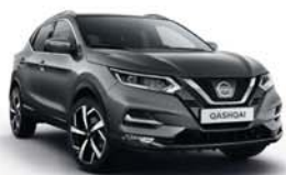
ŠEDÁ - M - KAD (*)