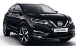
NIGHT SHADE - M - GAB