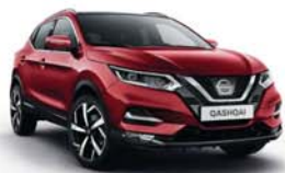
ČERVENÁ MAGNETIC - M - NAJ (*)