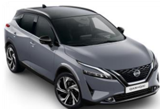
XFU Šedá Ceramic - Černá