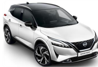
XDF Bílá Pearl - Černá