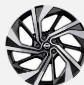
20" kola z lehké slitiny