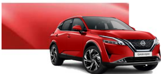
Z10 Červená (bez příplatku)