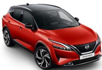
XEY Červená Sunset - Černá