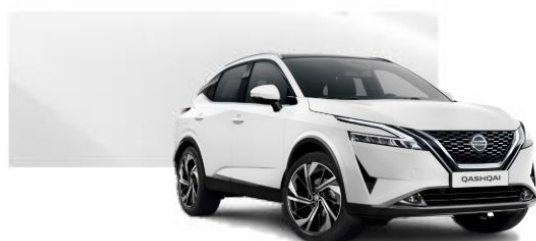
326 Bílá (8000 Kč)