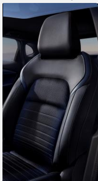
B - Černé látkové čalounění s tmavě modrými vložkami ze syntetické kůže