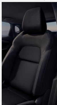
G - Černé látkové čalounění