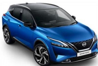
XFV Modrá Vivid – Černá