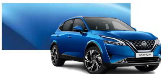
RCF Modrá Vivid