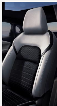
K - Černé látkové čalounění se světle šedými vložkami ze syntetické kůže