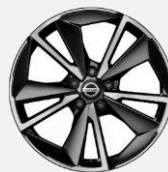
19" kola z lehké slitiny