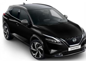
XDK Černá - Šedá