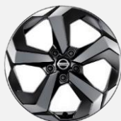
18" kola z lehké slitiny