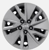
17" ocelové disky